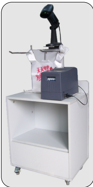
与缩排车构成缩排系统