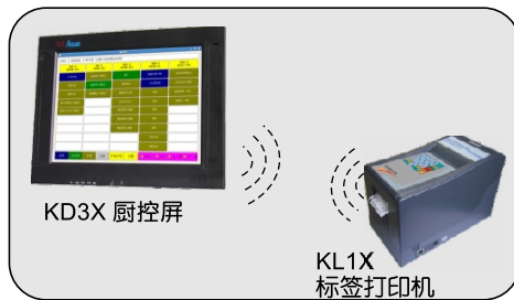
与厨控屏构成厨控系统