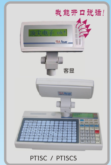
PT1SC / PT1SCS